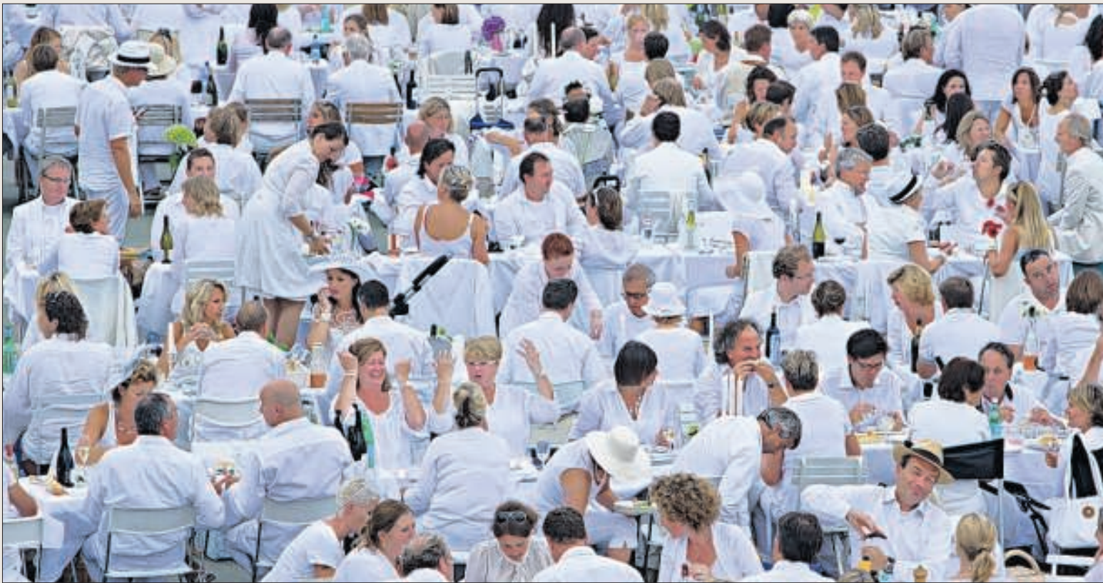
Diner en Blanc streek gisteravond met 1700 smulpapen neer bij de Erasmusbrug in Rotterdam.

Tiplijn: 010 4004 388 E-mail: rd.stad@ad.nl (ook voor nieuwsfoto's) Regiosport: 010 4066 478 E-mail: rd.sport@ad.nl Adverteren: 010 4066 236